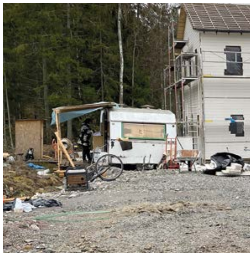
Bild 5. Boende i husvagn och toalett i skjul.