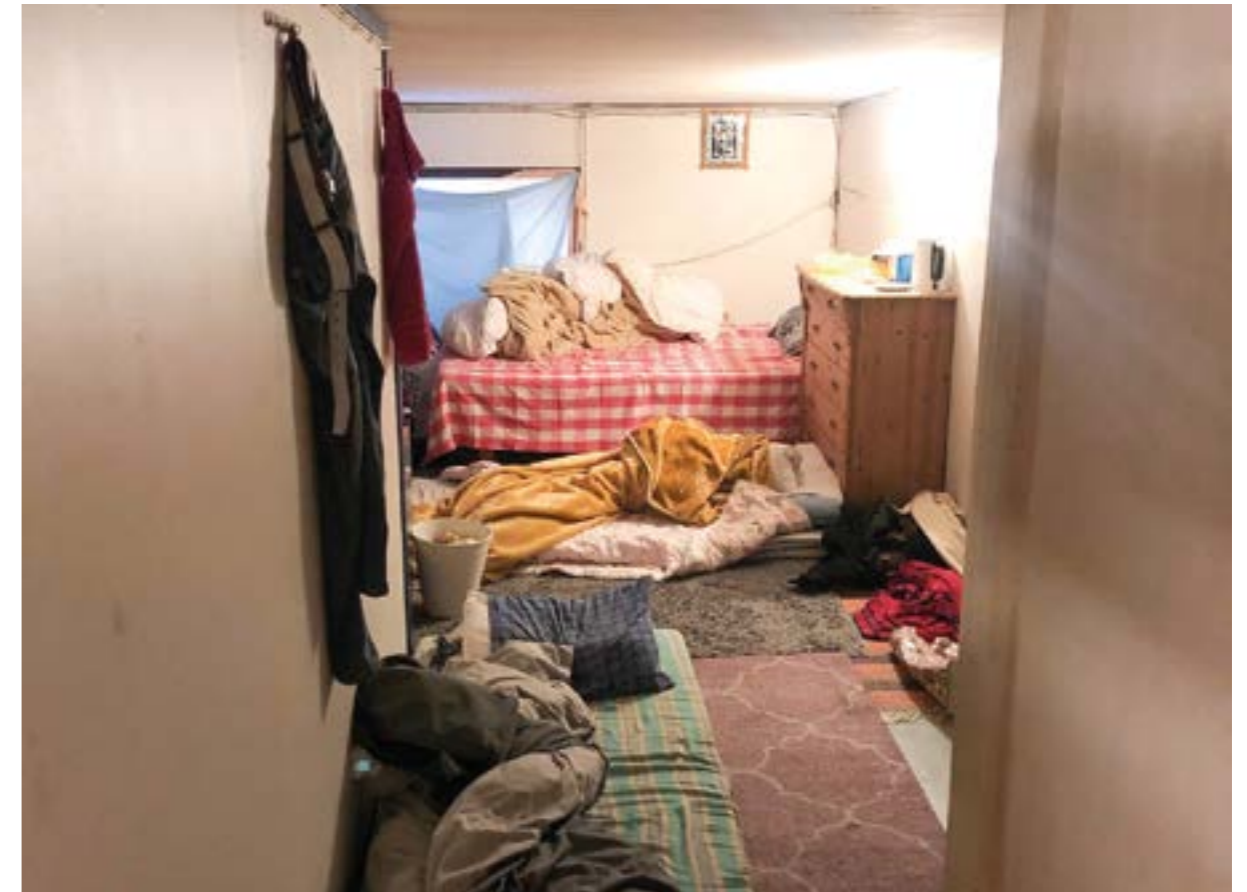
Bild 2. Boende på arbetsplats

Migrationsverket redovisar antalet misstänkta ärenden om människohandel som myndigheten kommer i kontakt med. Det är utsattheten som är i fokus, vilket innebär att siffrorna även omfattar individer som exploaterats utanför Sveriges gränser. Mellan 2017 och 2020 registrerades mellan 150 och 180 ärenden årligen som gällde människohandel för tvångsarbete. Mörkertalet bedöms som mycket omfattande, bland annat mot bakgrund av att Migrationsverket inte har i uppdrag att kontrollera arbetsförhållandena när ärendet inte gäller uppehållstillstånd. Myndigheten nås dock regelbundet av information om utnyttjande av asylsökande, personer som vistas illegalt i Sverige, personer som vistas här på grund av anknytning. Det är också svårt att berätta om regelöverträdelser för den som riskerar sin anställning genom att göra det. Inom brottsområdet människohandel och människoexploatering finns i vissa fall kopplingar till organiserad brottslighet. Det sker genom