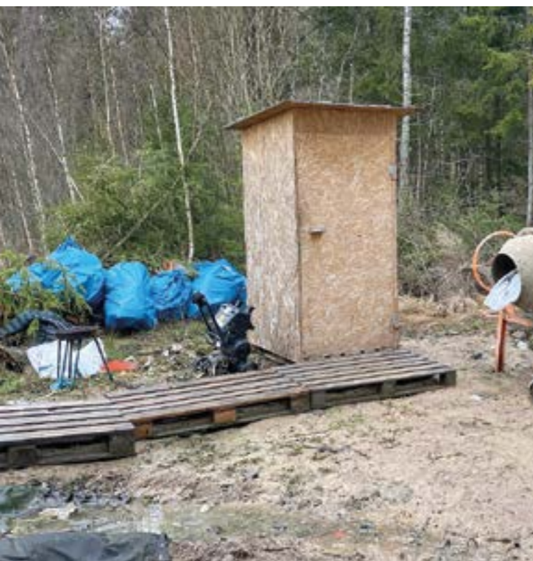
Bild 4. Skjultoalett för arbetare vid boendet.

Samhället står dessutom inför en stor utmaning i norra Sverige där stora satsningar görs när det gäller utbyggnad av infrastruktur och stora industrier. Myndigheterna behöver, både i ett tidigt skede och löpande, bistå med förutsättningskapande insatser. Detta samtidigt som brottsförebyggande åtgärder och kontroller genomförs.