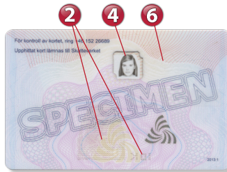
1 UV-mönster framsida