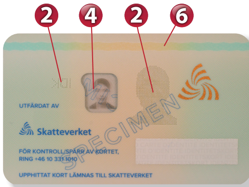
1 UV-mönster baksida