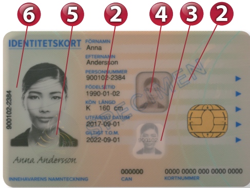
1 UV-mönster framsida

Tillverkat från september 2017 och fortfarande.