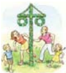
Illustration: Michael Schneider

Du som är löntagare eller pensionär kan få skatteåterbäringen redan före midsommar. Men då måste du senast den 3 maj 2010